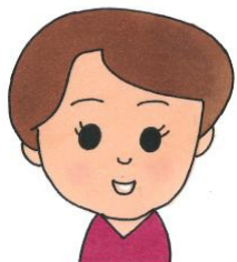
里親リクルーター

パネル展示や街頭活動など、里親を知ってもらう活動を行っています。里親制度や里親さんの体験談を聞いていただく「出前講座」も開催しています。